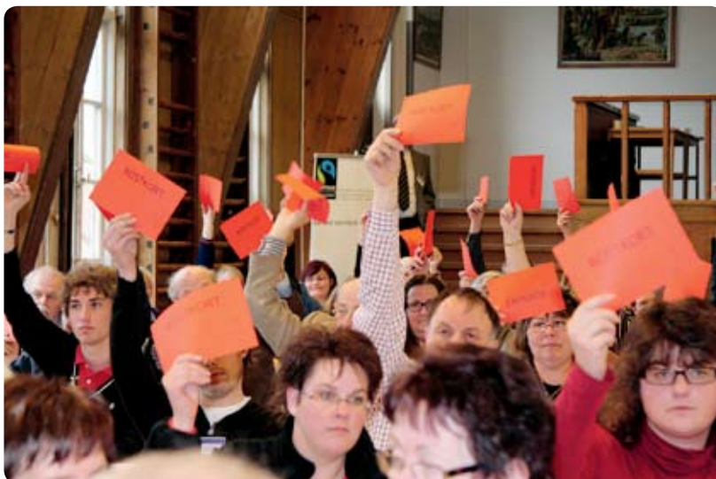
Årets föreningsstämma hölls på Tärna Folkhögskola i Sala. Sammanlagt 93 av föreningens 101 ombud deltog i stämman.

På föreningens webbsida finns information om föreningen och aktuella länkar.