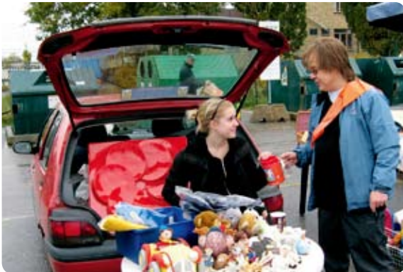
Inför Världens Barngalan i oktober rådde stor aktivitet bland förtroendevalda och personal. En av aktiviteterna var en "bakluckeloppis" utanför Coop Extra Österplan, Örebro.

Kooperation Utan Gränser och Vi-skogen deltog i insamlingen för Världens Barn i oktober 2008. Våra förtroendevalda samlade in hela 171 458 kr. Utöver detta skänkte Svea och flera andra konsumentföreningar vardera 100 000 kr. Totalt bidrog konsumentkooperationen med två miljoner kr.