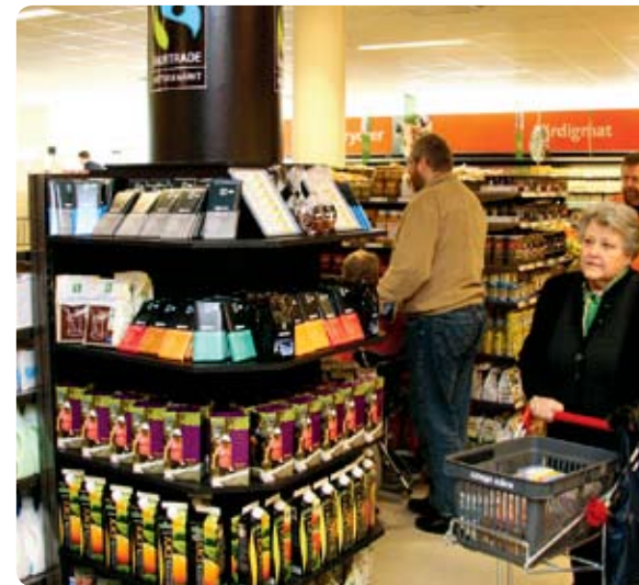
I början av april fick medlemmarna i Örebro tillgång till en ny butik, Coop Nära på Änggatan. Rättvisemärkta och ekologiska produkter har fått en tydlig exponering i den nya butiken.

När det gäller arbetet med att minska klimatpåverkan från Coops transporter inleddes ett partnerskap med Green Cargo under 2008. Partnerskapet innebär att Coops långväga transporter kommer att flyttas från lastbil till järnväg. Coop kommer därmed att minska sin klimatpåverkan med cirka 8 000 ton koldioxid per år. Det första "Cooptåget" kommer att rulla under 2009.