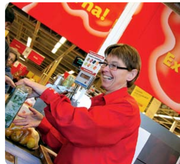
Under 2008 öppnade inte mindre än tre Coop Extra-butiker i Konsumentföreningen Sveas område. Bl a Coop Extra i Katrineholm i oktober.