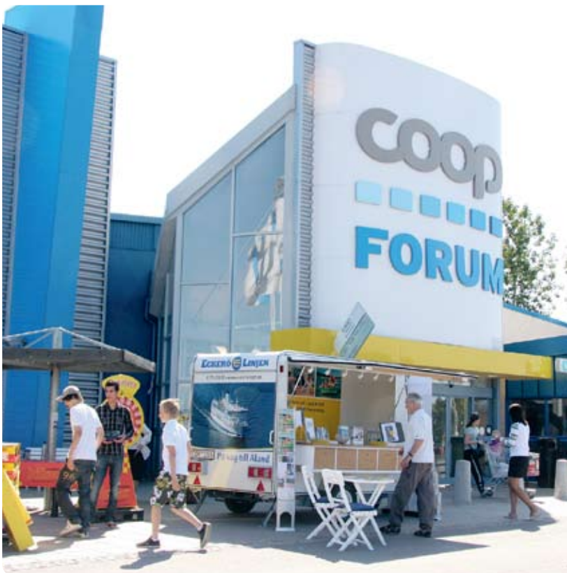
Strax före midsommar öppnade Coop Forum Norrtälje efter en omfattande upprustning.

EKOLOGISK FRUKOST är en annan uppskattad aktivitet som genomförts under året. Under aktiviteterna har deltagarna fått tips om hur man dukar upp en ekologisk frukost.