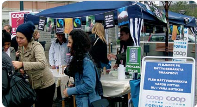
Utnämningen av Norrköping till en Fairtrade City skedde i samband med Kulturkvällen den 29 september, då bl a distriktsstyrelsen deltog. I Coops tält fanns både medlemsråd och styrelseledamöter och bjöd på rättvisemärkta produkter.

En stor händelse som påverkar alla Coops butiker är beslutet att återta Coop Sveriges butiker från Coop Norden. Förhandlingar slutfördes under hösten med