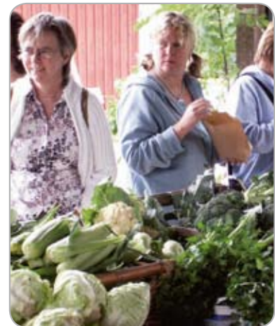
Vid en ekologisk medlemsresa till Väddö passade deltagarna på att handla ekologiskt odlat vid Senneby Trädgård.

som anordnas av Barncancerstiftelsen i Östergötland. På området fanns Coop-tältet med förtäring och också Coops hoppborg och karusell. De pengar som samlas in i samband med arrangemanget används på olika sätt för att stödja familjer med barn som drabbats av cancer. Vårt bidrag i år var 10 000 kronor.