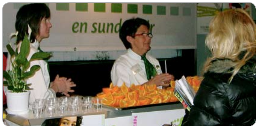
I samarbete med Coop Konsum deltog föreningen i en utställningsmonter på Må Bättre-mässan i Örebro. Cirka 3 000 personer besökte montern.