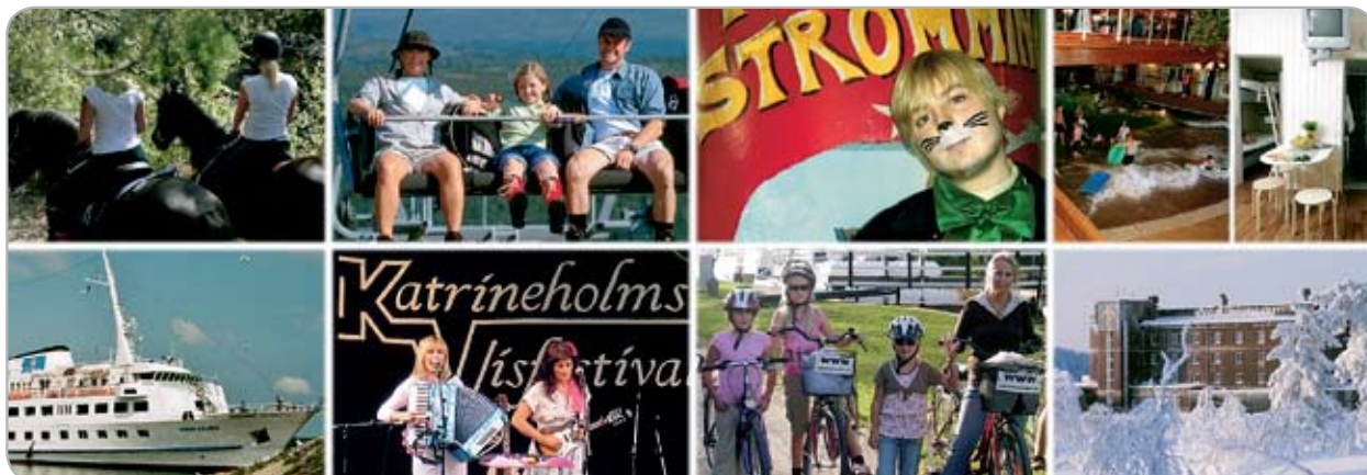
Föreningens egna medlemsförmåner inom kultur, hälsa, sport och rekreation utnyttjades av 12 228 medlemmar. Förmånsvärdet uppgick till ca 2,9 miljoner kr.

12 228 medlemmar tog del av föreningens egna medlemsförmåner till ett värde av ca 2,9 miljoner kronor inom områdena kultur, hälsa, sport och rekreation.