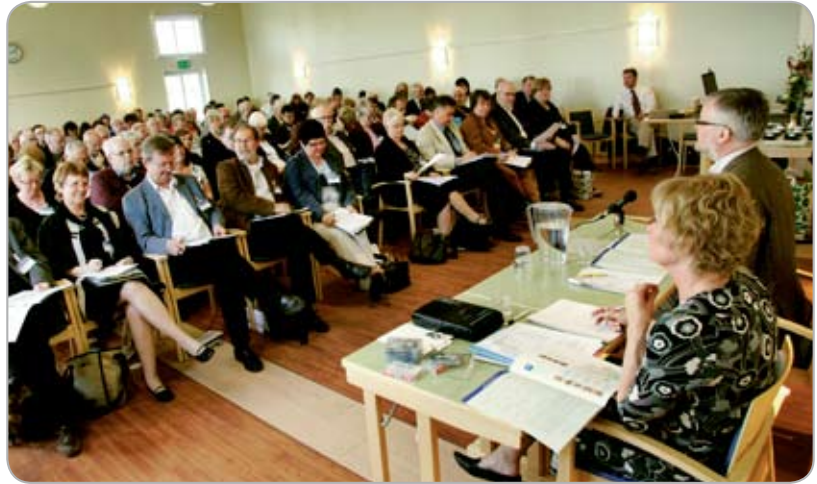
Uppslutningen var i det närmaste total vid årets föreningsstämma på Fagerudd utanför Enköping. 98 av 101 ombud hade infunnit sig till stämman.

På föreningens webbsida finns information om föreningen och aktuella länkar. Där finns föreningens medlemserbjudanden och information om tematräffar och aktiviteter. På sidan finns en söktjänst för att hitta närmaste Coopbutik och information om KF Sparkassa. Sidan innehåller dessutom ett intranät för förtroendevalda med information som behövs för uppdraget.