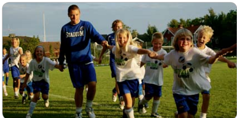
Medlemsrådet i Coop Konsum Svampen var med när en fotbollsskola ordnades i Örebro. Positiva möten med cirka 600 ungdomar och föräldrar.